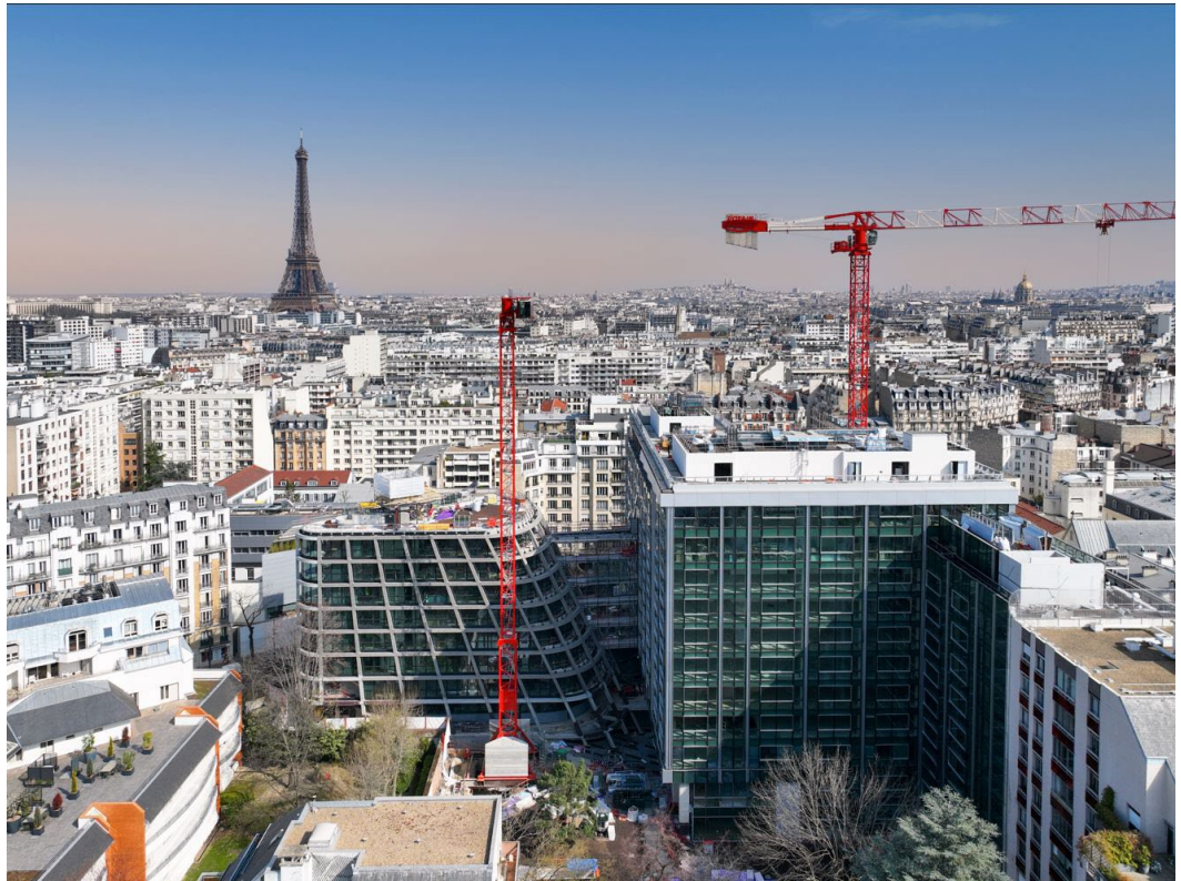
Biome – Paris 15 e